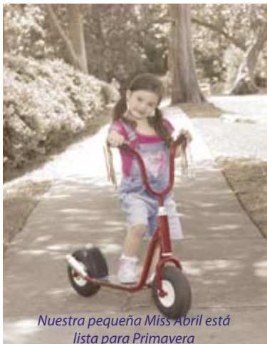
Nuestra pequeña Miss Abril está lista para Primavera

Negación: Asociación del Síndrome de Down de Dallas (DSG) no asume ningún específico o responsabilidad implicada con respecto a la interpretación, al uso, al uso erróneo, o a la comunicación subsecuente del contenido o de la información editorial contenida en esta publicación. Las opiniones, la creencia, y los puntos de vista expresados adjunto son las de los autores y de los contribuidores individuales y no representan necesariamente los del DSG, de sus directores, de los miembros, o del redactor de esta publicación. El contenido de todas las noticias de DSG se proporciona como un servicio público para el propósito informativo solamente y no es un sustituto para el consejo médico o profesional. Las noticias de DSG no endosan ninguna terapia particular, institución, o sistema profesional. Se presenta la información adjunto como es, sin garantía de la clase expresa o implicada. Las sumisiones a las noticias de DSG se corrigen para asegurar uso de la lengua de la "gente primero".