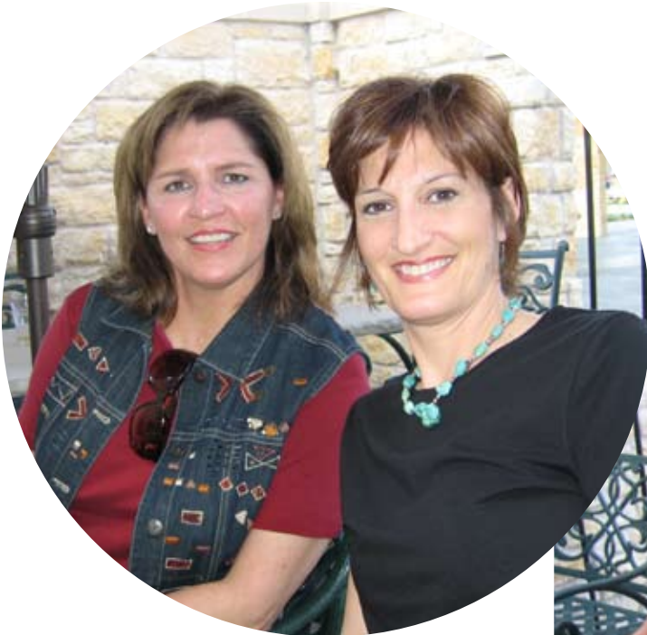
Todos hicieron nuevas amistades en el Escape de Mami's el 30 de marzo del 2008 en Patrizio's en Highland Village.