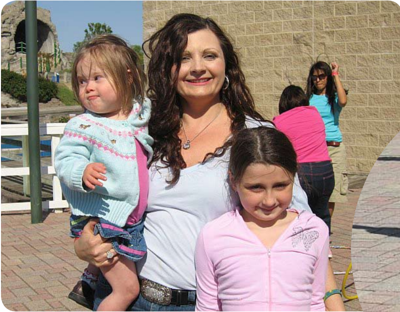
The Down Syndrome Guild's Annual Picnic and Membership Meeting was a huge success with over 500 attendees.