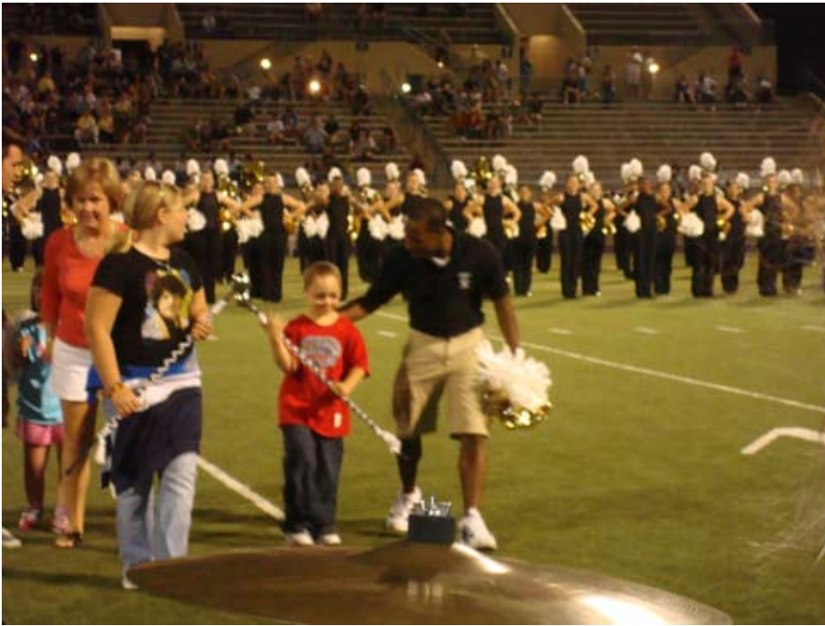
Familias del DSG participaron durante el show de medio tiempo del partido de fútbol de la preparatoria Plano East Hight, el viernes 5 de septiembre del 2008, como parte del evento de caridad Plano East Golden Girls con beneficencia al DSG.